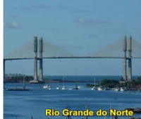
Rio Grande do Norte